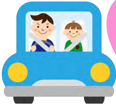
【カーライフローン】